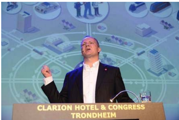
Samferdselsminister Ketil Solvik-Olsen åpner kongressen med et framtidsrettet innlegg om samferdsel